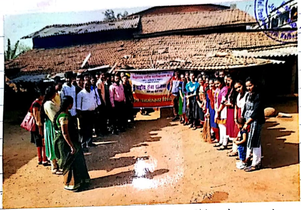
महाविद्यालयातील राष्ट्रीय सेवा योजनेचे स्वयंसेवक विद्यापीठाच्या धोरणीनी.